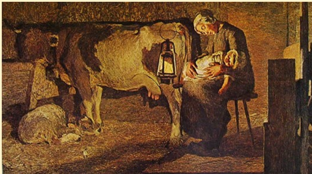
Opera di Giovanni Segantini Le due Madri